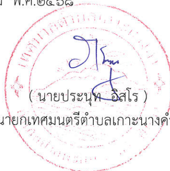
(นายประนพ อัสโร) นายกเทศมนตรีตำบลเกาะนางคำ